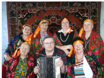
Юбилей с.Мироновка вокальная группа «Бабушка»

Казахстан исторически стал местом взаимного обогащения и взаимопроникновения различных национальных культур. Как подчеркивает глава нашего государства Н.Назарбаев: «Наши евразийские корни позволяют соединить восточные, азиатские, западные, европейские потоки и создать уникальный казахстанский вариант развития поликультурности». В нашей стране делается всё, что бы представители других культур, и частности украинской, чувствовали себя частью общенациональной. Сегодня украинская диаспора четвёртая по численности в Казахстана – после казахов, русских и узбеков.