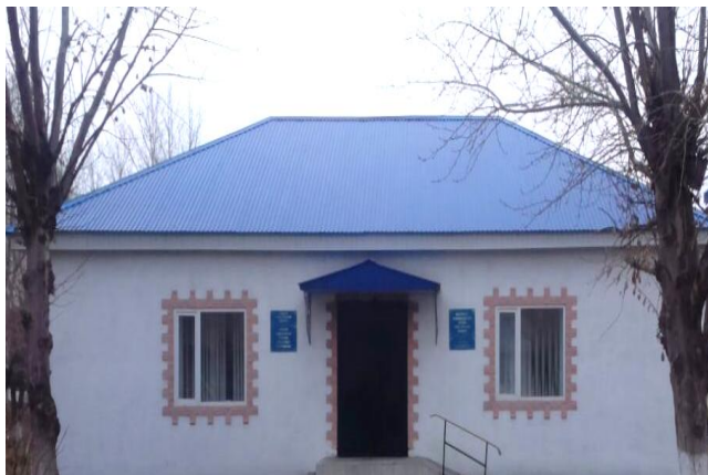
Рисунок 1 – «Краеведческий музей имени Смагула Садвакасова»

В 2011 году в селе Талшик Акжарского района был открыт краеведческий музей имени Смагула Садвакасова( рисунок 1).