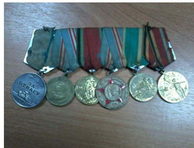
Комплекс медалей участника ВОВ.