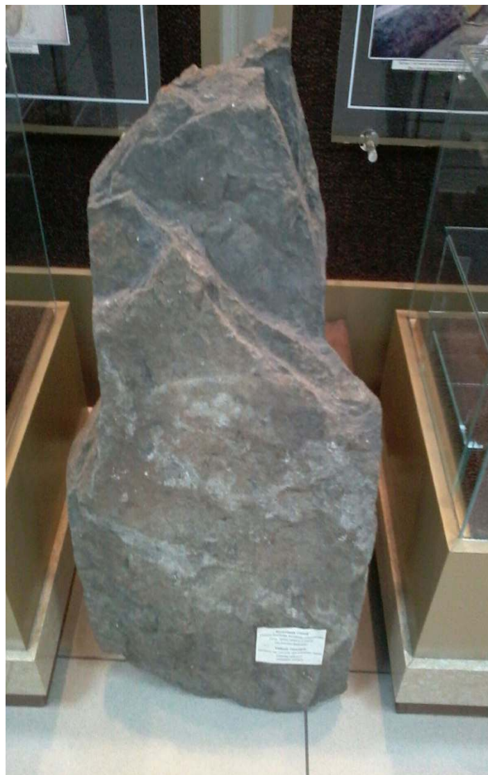
Археологические находки, найденные в кургане Байкара.