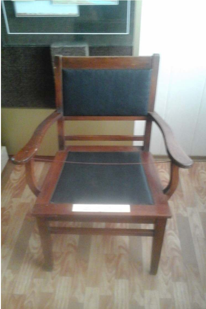
Кресло первого руководителя 1950-1960 г.г.