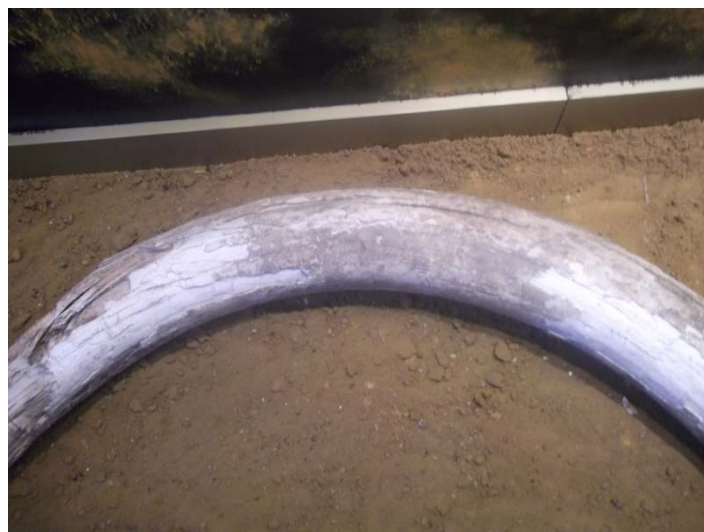
1/3 часть бивня мамонта.