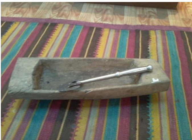
Посуда для шинкования капусты.