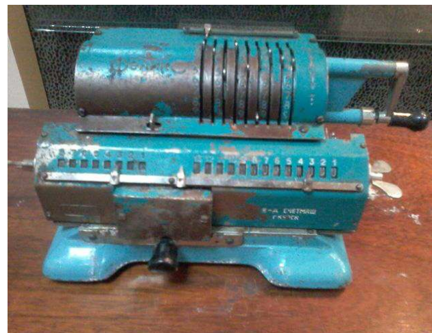
Счетная машинка "Феликс."