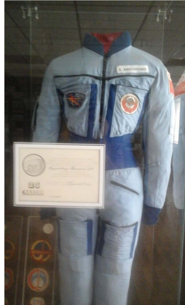
Тренировочный костюм летчика-космонавта А. Викторенко.