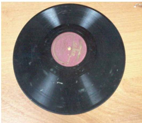
Пластинка с речью Сталина, 1937 г.