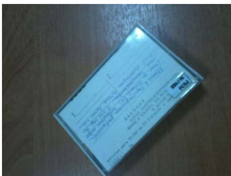
Кассета, выступление академика Е. Букетова на митинге.