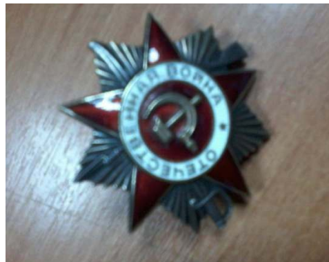
Орден "Отечественной войны II степени."