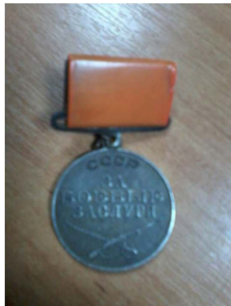
Медаль "За боевые заслуги".