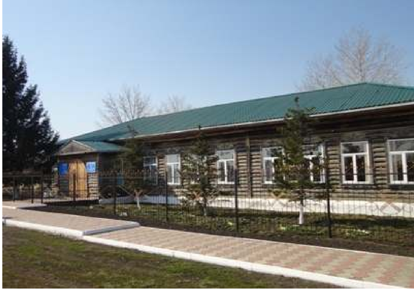
Северо-Казахстанский государственный университет им. М. Козыбаева Кафедра «Ассамблея народа Казахстана»