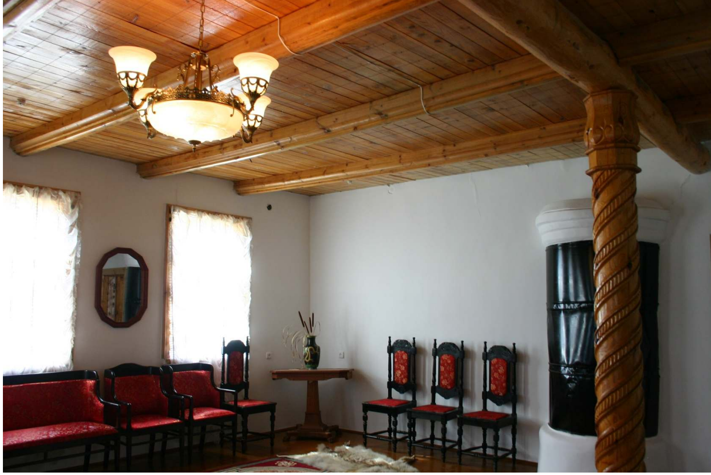
Северо-Казахстанский государственный университет им. М. Козыбаева Кафедра «Ассамблея народа Казахстана»