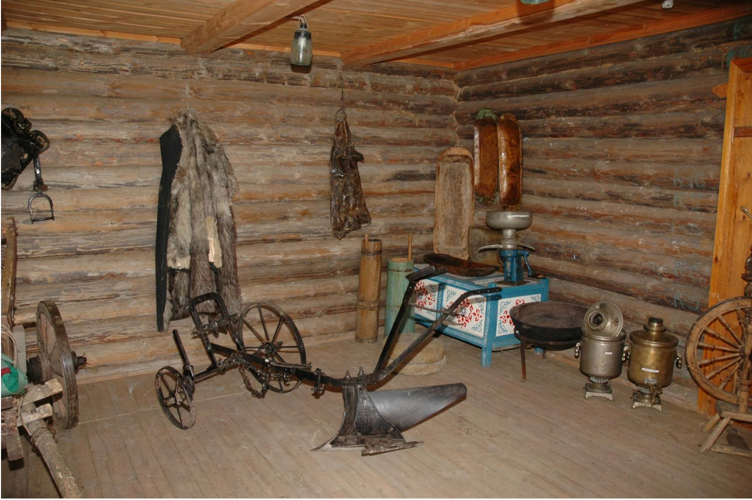
Северо-Казахстанский государственный университет им. М. Козыбаева Кафедра «Ассамблея народа Казахстана»