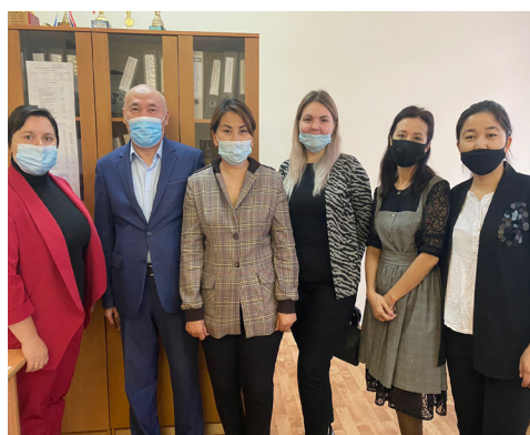
КАФЕДРЕ «ЖУРНАЛИСТИКА» KOZYBYE UNIVERSITY – 5 ЛЕТ!